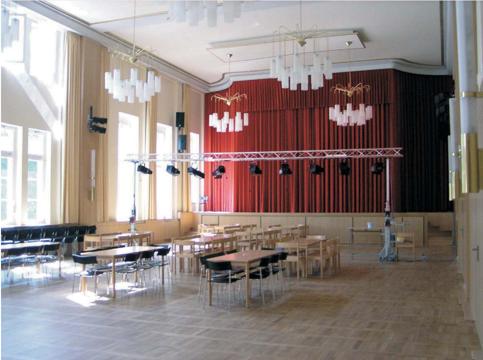
HAUS AM BREITSTROM Meister-Eckhart-Straße 6