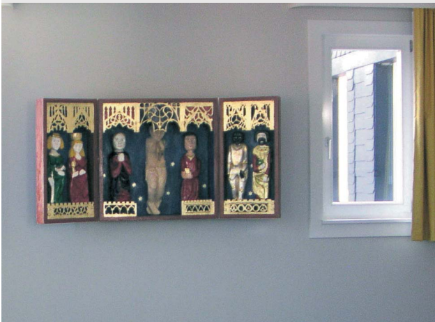
Von Schülern gestalteter Flügelaltar im Raum der Stille