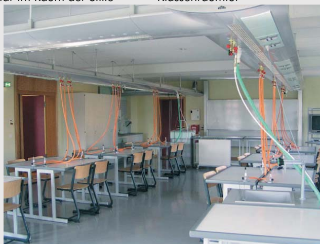
Fachkabinett für Chemie mit obenliegender Installation

Bauherr: Evangelischer Kirchenkreis Erfurt Nutzfläche: 4.500 m 2 Bauzeit: 2001-2003