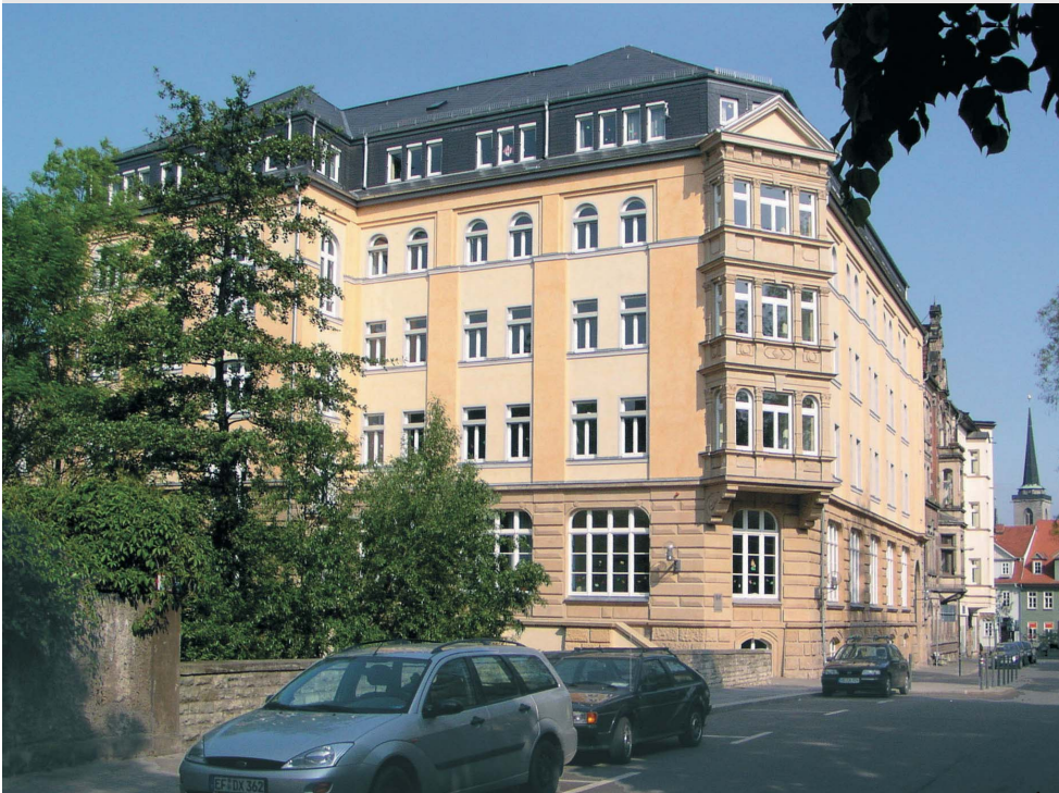
Ansicht von Süden

HAUS AM BREITSTROM Meister-Eckhart-Straße 6