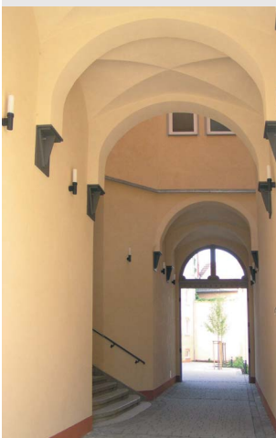
Wieder geöffnete Durchfahrt

Eine wechselvolle Geschichte als Hotel, Verwaltungsgebäude, "Haus der Deutsch-Sowjetischen Freundschaft" und zuletzt als Bürohaus kennzeichnet das heutige "Haus am Breitstrom". Mit dem Einzug des Evangelischen Ratsgymnasiums in den - wegen der äußerst beengten Verhältnisse im bisherigen Schulgebäude dringend erforderlichen - frisch sanierten Erweiterungsbau wurde nun ein neues Kapitel hinzugefügt.